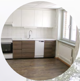
Nytt privat seniorboende