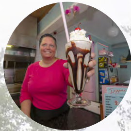
Företagsprofilen - Älvåkragrillen