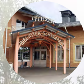
Restaurang Fluxen stänger