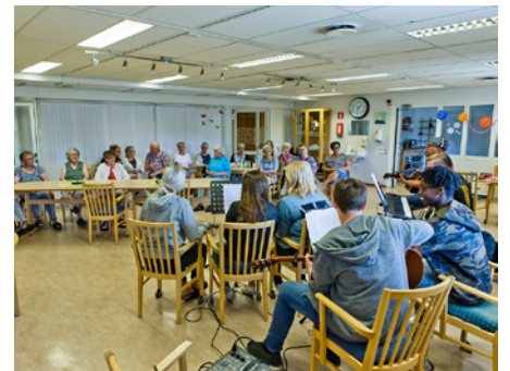
Ett av gigen gjordes hos Dagverksamheten i Fluxen.