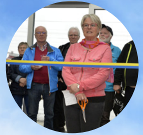
Invigning av Älvsbyns nya resecentrum