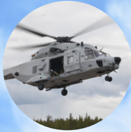
Landshövdingen besökte Älvsbyn