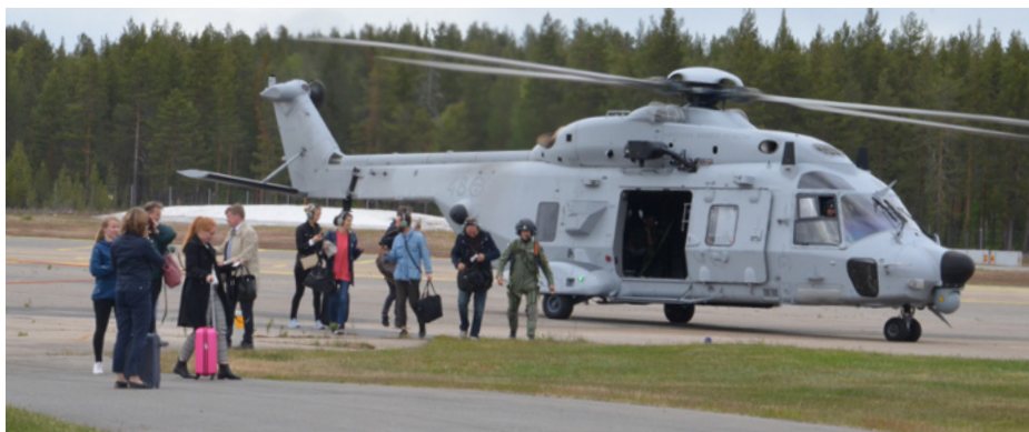
Som fallen från skyarna kom landshövdingen till Älvsbyn för första gången i sällskap av representanter för Folk och Försvar.