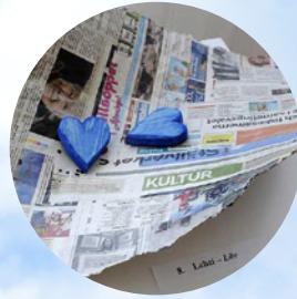
Älvsby konstförening fyller 40 år