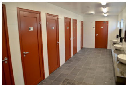
Fräscha toaletter och ett nytt, fint kök är bara en del av campingens nya utrymmen.