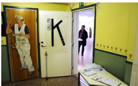
Galleri K – ett begrepp inom konstkretsar.

– Kultur i överlag är viktigt. Ett samhälle utan kultur är ett svagt samhälle, betonar hon.