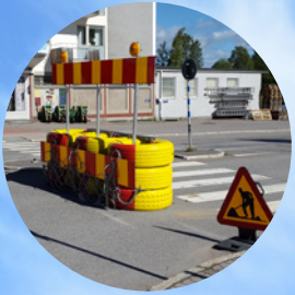
Älvsbyns energi gör stora investeringar