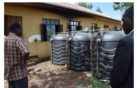
Biogasanläggning på Ubetu Secondary School.

Den svenska delegationen passade på att besöka biogasanläggningarna på både Mamtakuna och Ubetu under sin resa.