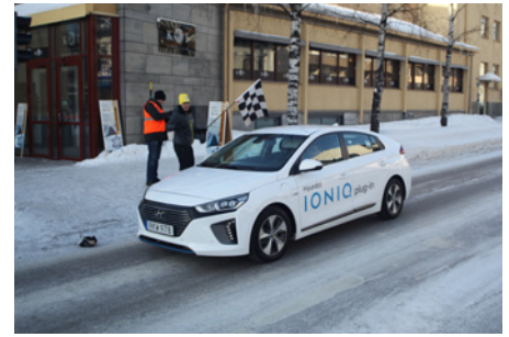
Målgång för det segrande ekipaget.

Rallyt är en del av Älvsbyns kommuns projekt CELLER-i, vars syfte är att undersöka hur bilarna klarar sig i det kalla klimatet i norr. Under resan mäts bilarnas förbrukning, snittfart med