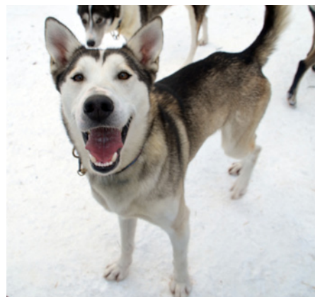
Hundarna är snälla och vana vid människor.