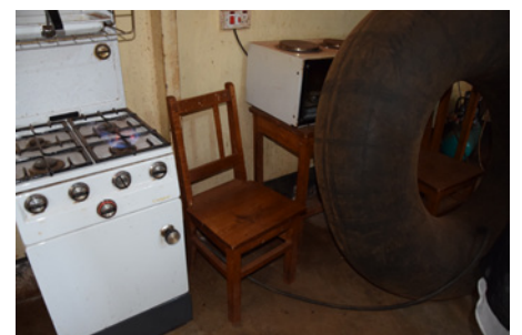
Enkel biogasanläggning i lärarköket på Mamtakuna folkhögskola.