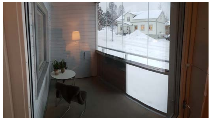
Balkong fotograferat inifrån en av lägenheterna.