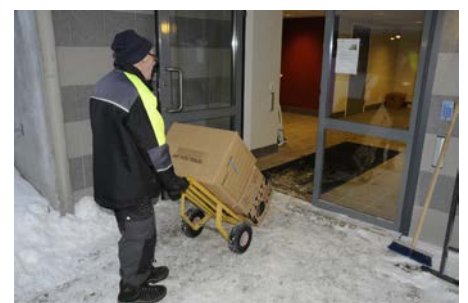
På plats under invigningen fanns flertalet hyresgäster, som efter att bandet klippts påbörjade flytten till sina nya hem.