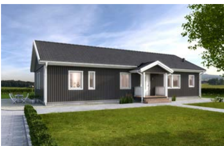
Så här ser Sveriges mest sålda husmodell ut.

– Otroligt roligt att så många gillar husmodellen, säger Frida Björk, CAD-ritare på Älvsbyhus.