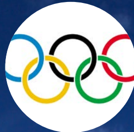
Tre älvbybor till vinter-OS