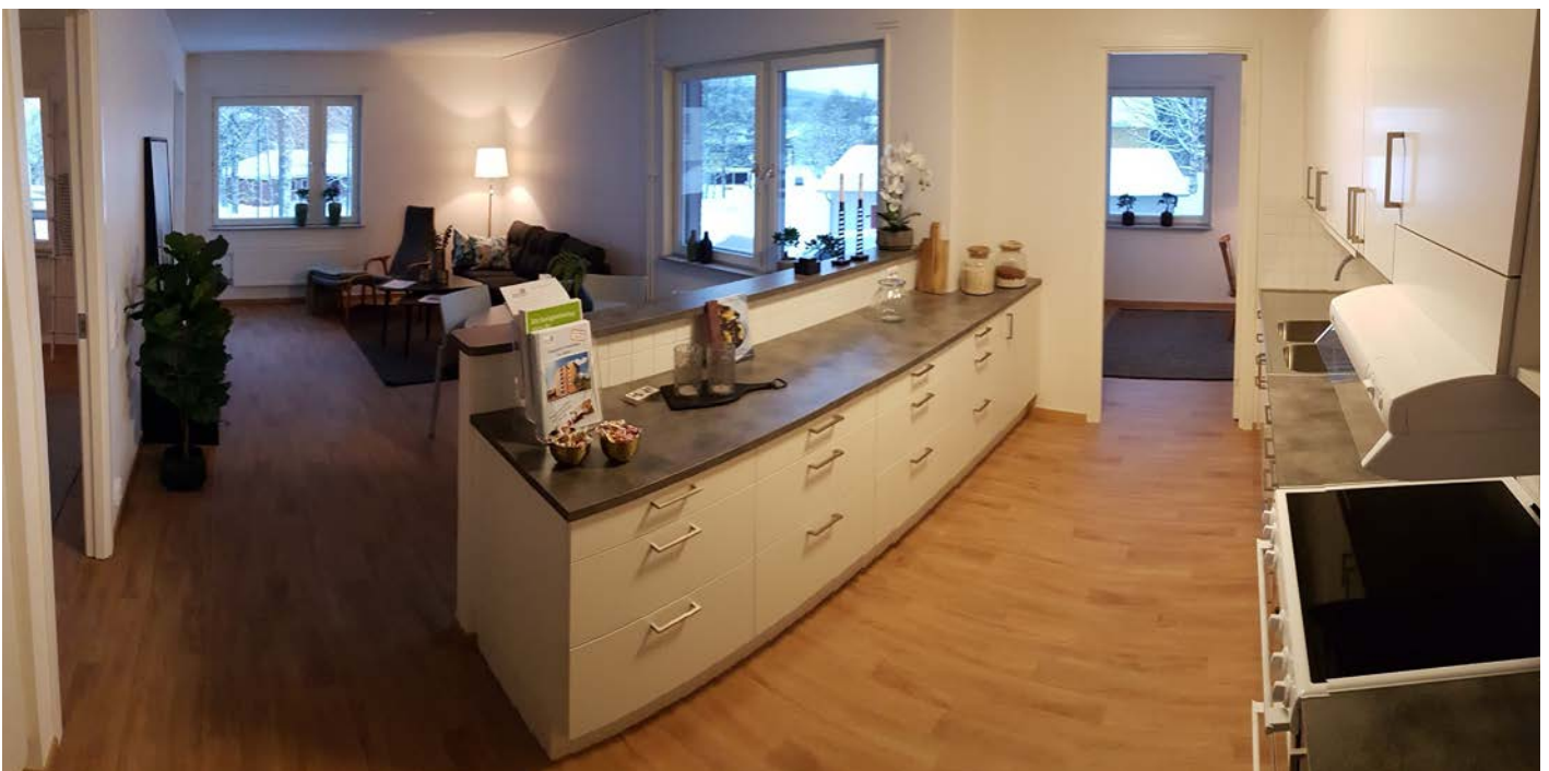
Interiörbilder från en av de nya lägenheterna: