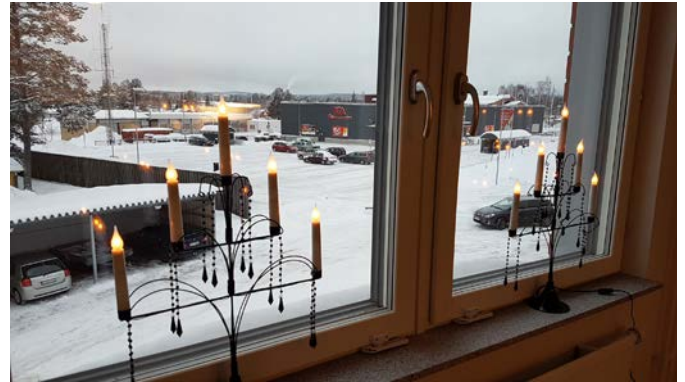
Adventsstakarna på plats.