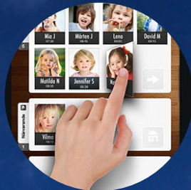
Nuddis närvaro-system införs