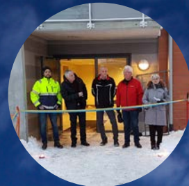
Invigning av nytt hyreshus