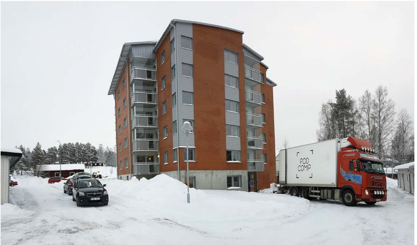
Flyttbilarna avlöste varandra under den första inflyttningsdagen till det nya hyreshuset.