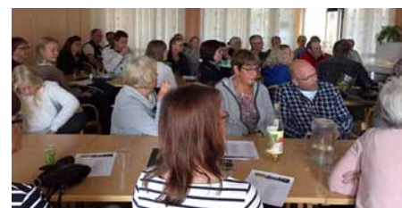
Mer än fullsatt på restaurang Fluxen när sjuttio deltagare kom.

– Barnen tävlar om vem som först ska hitta flaggan på toppen, det blir alltid roligt.