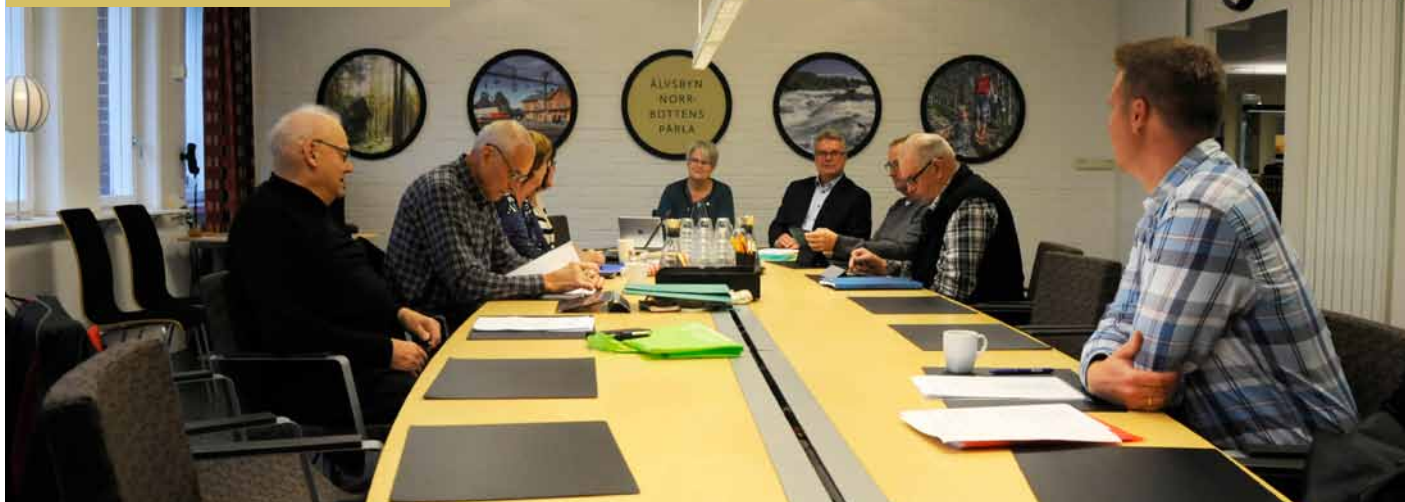
Budgetmöte för politiker och tjänstemän.

Under företagsprofilen kan du läsa om ett av alla företag i kommunen. Har du tips på ett företag som du skulle vilja att vi skriver om? Hör då gärna av dig till Älvsbybladet.