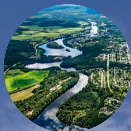
Turismen har ökat med 20%