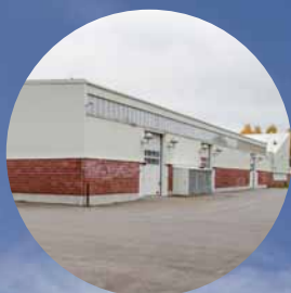
Älvsbyns första datacenter