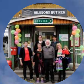
Ny servicepunkt i Visträsk