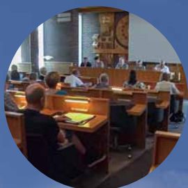
Så styrs en kommun