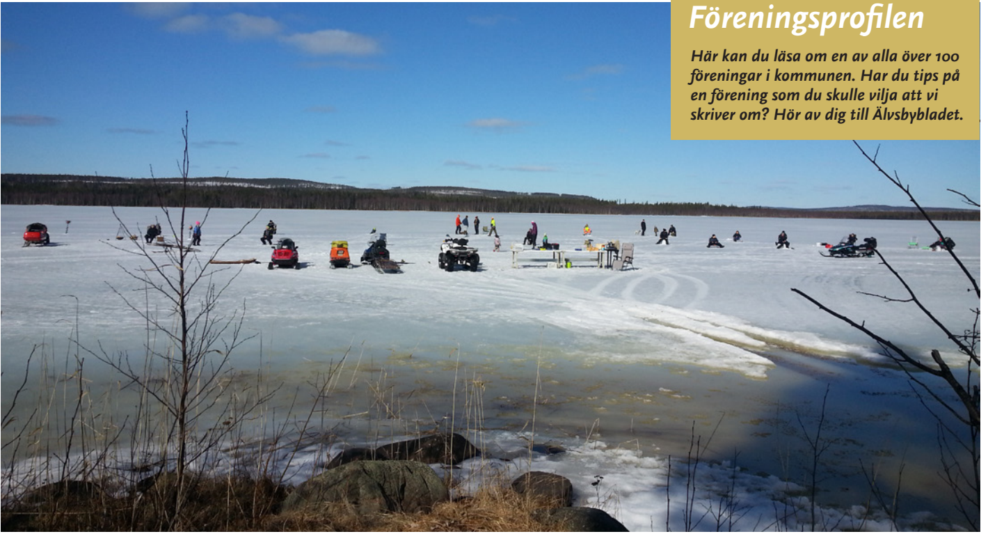
Fisketävling i Altervattnet under långfredagen.

Här kan du läsa om en av alla över 100 föreningar i kommunen. Har du tips på en förening som du skulle vilja att vi skriver om? Hör av dig till Älvsbybladet.