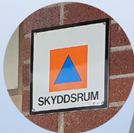
Skyddsrum i kommunen