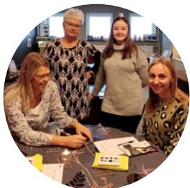
Stor brist på vikarier