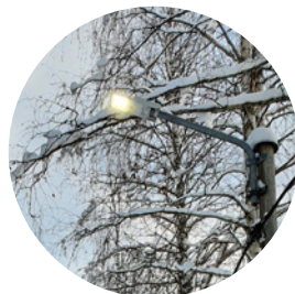
Visträsk IF lyser upp