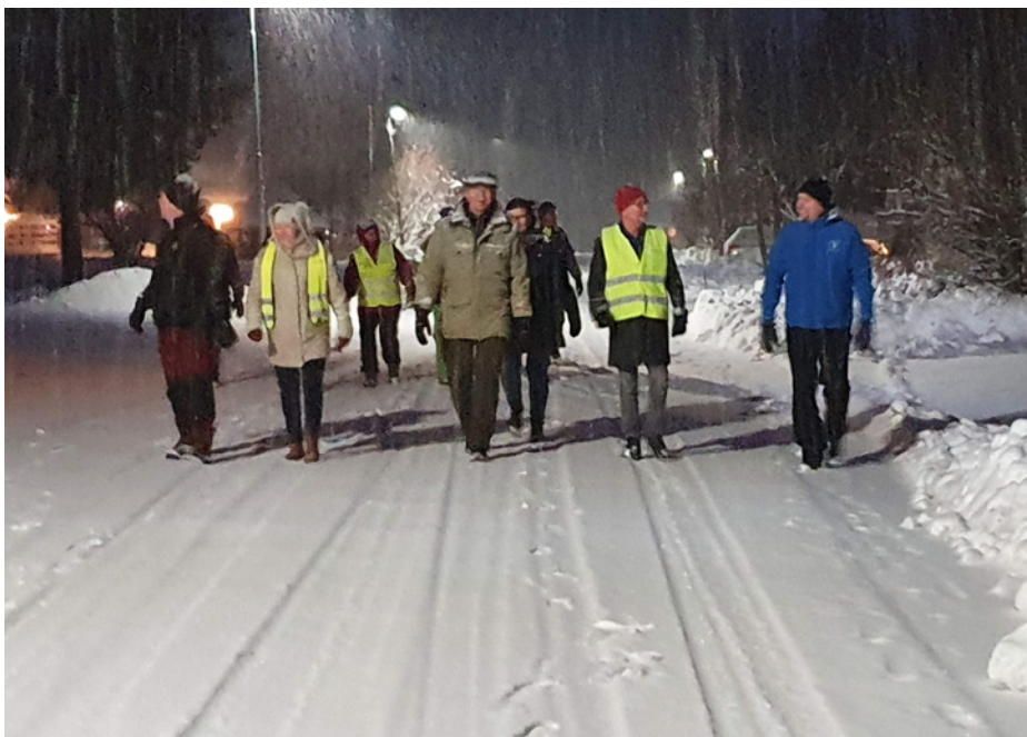
Inbjudna till trygghetsvandringen var medborgare i Visträsk, byaföreningen, politiker, personal från kommunens bolag och kommunens tjänstepersoner från de flesta verksamhetsområdena.