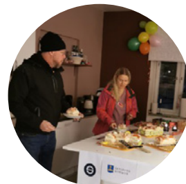
Hemtjänsten firar med tårta