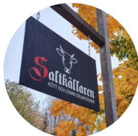
Saltkällaren i Tvärån