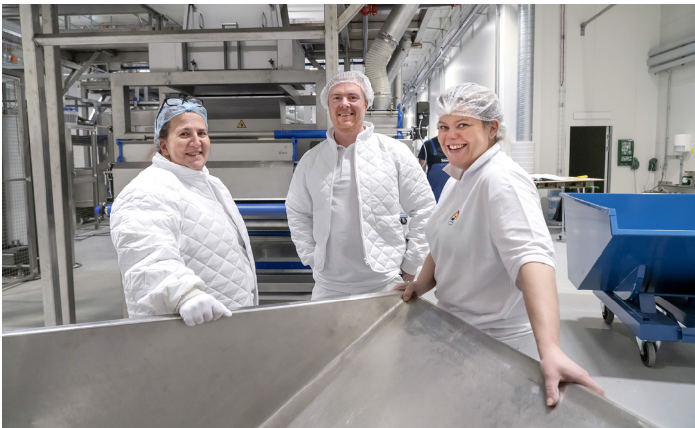
Det är stor glädje bland personalen över att åter vara i gång och baka polarbröd.