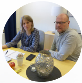
Växa på Vux