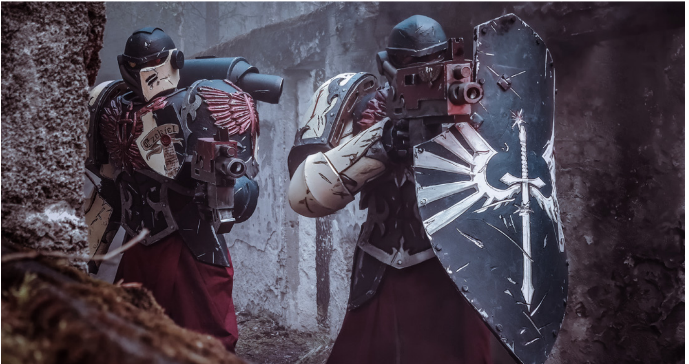
Svjan-Tristan har gjort rustningar och kostym till filmen.