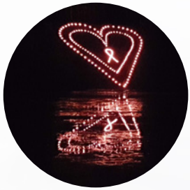
Byaförening med stort hjärta