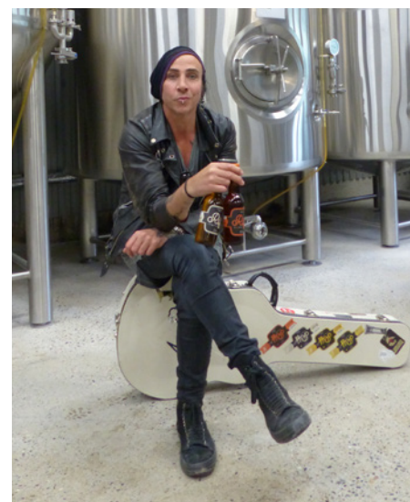
Gitarristen Dregen brygger sitt öl Riff i Älvsbyn.

– Det skulle vara kul att ordna en gårdsfest här på bryggeriet när pandemin är över med musik och ölprovning.