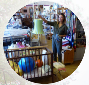
Liv ger liv i Vidsel