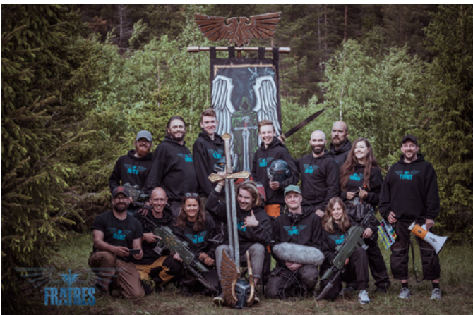
Filmteamet samlat.