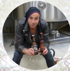
Dregen brygger i Älvsbyn