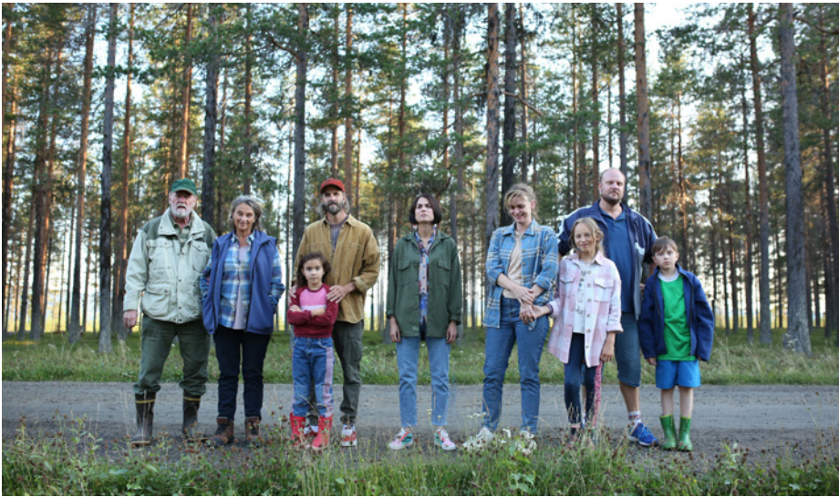
Huvudrollsinnehavarna i filmen "En dag kommer allt det här bli ditt" är Karin Franz Körlof, Peter Haber och Suzanne Reuter. I andra ledande roller ser vi skådespelarna Liv Mjönes, Arvin Kananian, Mattias Fransson, Emil Almén och Filip Berg.