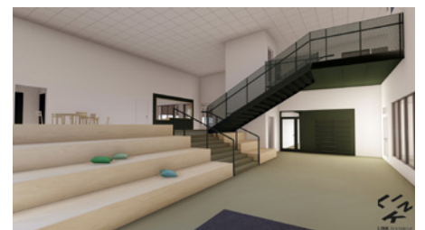
Skisser på den nya sim- och sporthallen.