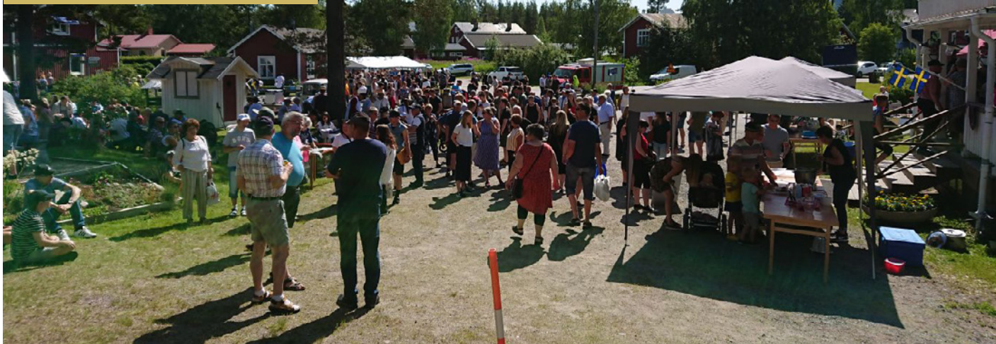
Visträskdagen lockar många varje år. Detta foto är från 2019.

Här kan du läsa om en av alla 114 föreningar i kommunen. Har du tips på en förening som du skulle vilja att vi skriver om? Hör av dig till Älvsbybladet.