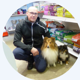
Excentrum har ny ägare