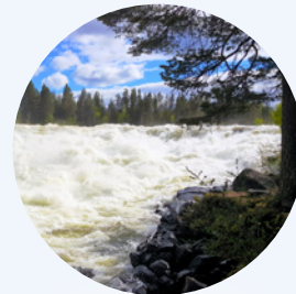
Ny busslinje till Storforsen