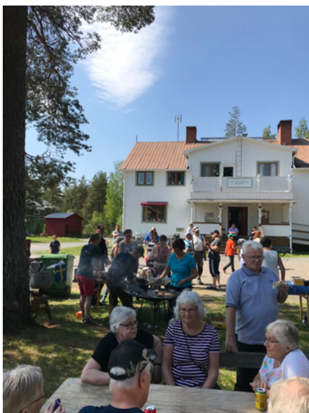
Samtal och aktiviteter framför den fina bygården Mejeriet. Detta foto är från 2019.

– Nu hoppas vi bara att vi kan börja ha verksamhet snart igen, tillägger hon och får medhåll av de andra.