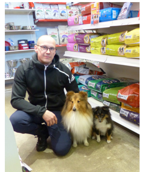
En nyhet på Excentrum är att hundar får följa med in och socialisera.

– Det här känns riktigt bra och det är kul att MRA:s och Excentrums personal teamar ihop. Att bli ett gemensamt arbetslag kan vara en fördel när arbetsbelastningen blir för hög i den ena av verksamheterna. Då kan personal från den ena verksamheten hjälpa till i den andra, säger han.