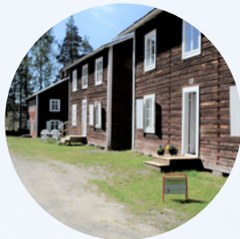
Guidning i Älvsbyns kyrkstad