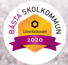
En av Sveriges bästa skolkommuner