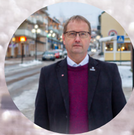
Att vara kommunalråd