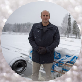
Hotell Storforsen mångmiljonsatsar