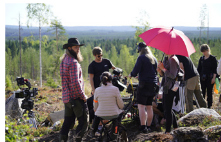
Förberedelser för inspelning någonstans i Älvsbyns kommun.