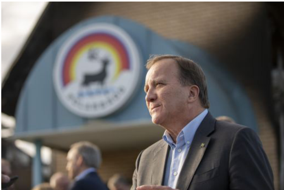
Statsministern besöker Polarbageriet i Älvsbyn en vecka efter storbranden.