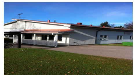
Aktivitetshuset på Lövgatan 1 i Älvsbyn.

Aktivitetshuset är en daglig verksamhet som vänder sig till vuxna med funktionsvariationer i åldern 18-67 år. Personer med intellektuella, fysiska eller psykiska funktionsvariationer kan ansöka om insatsen daglig verksamhet. Personer som är deltagare på Aktivitetshuset måste ha ett beslut på daglig verksamhet enligt "Lagen om stöd och service till vissa funktionshindrade" (LSS) eller Socialtjänstlagen (SoL).