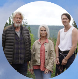
Jägarna säsong 2