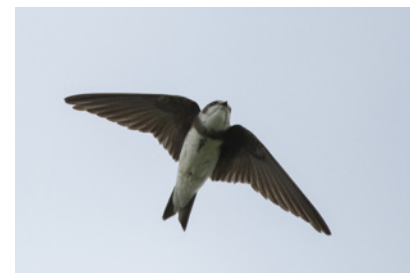
Backsvala.