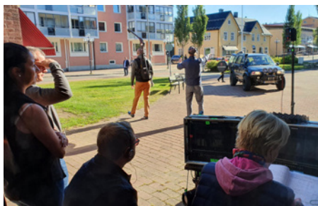
Regissören har egna bildskärmar för att se vad som filmas.

– Erik är en människa som åldras, som vi alla gör. Han flydde tidigt från sina hemtrakter och bosatte sig i Stockholm, men rötterna har aldrig gått ur och nu har han ett ambivalent förhållande till sin hemort. Han flyttade tillbaka för att stanna, men flydde därifrån en andra gång. Sedan tvingades han dit, försonades på något sätt med det, men återvände till Stockholm igen, för att sedan fly tillbaka till