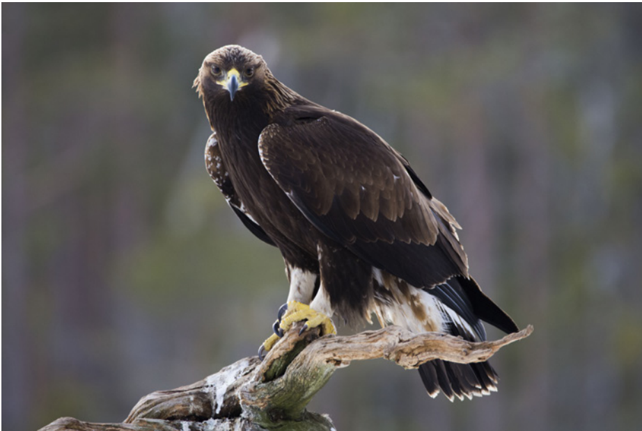
Den mäktiga kungsörnen har allt svårare att hitta häckningsplatser eftersom den behöver kraftiga träd i orörda skogar.