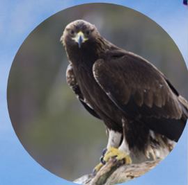
Rovfåglar i kommunen