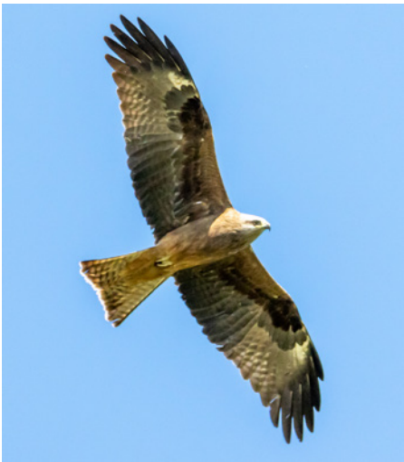
Rovfågeln Brun glada känner man igen på stjärten och den speciella färgen.

par i hela landet. Minskade miljögifter och ett aktivt arbete för att de ska föröka sig igen har lett till att det nu finns drygt 200 par. Minst fem av dessa finns i Älvsbyns kommun på lika många olika berg.