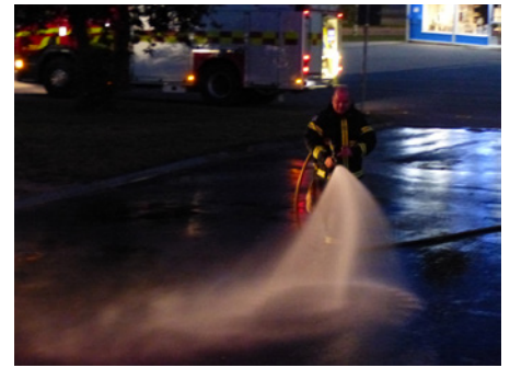
Det ska spelas in en regnig kvällszen framför Forum, men eftersom det inte har regnat är brandkåren inkallad för att få det att se ut som om det nys har regnat.