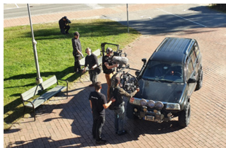
En del av filmens scener spelas in med flera kameror samtidigt.