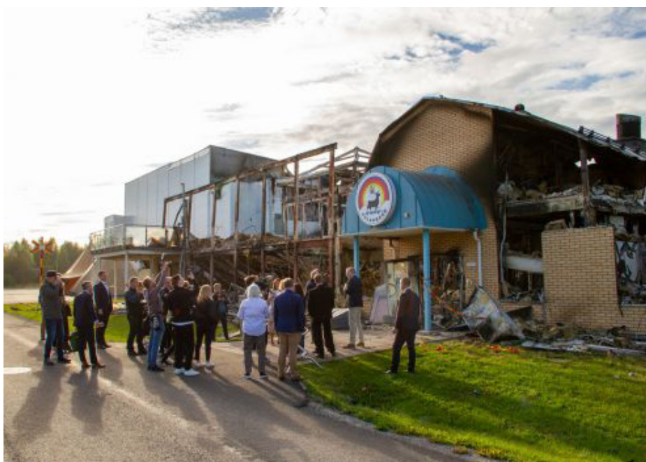
Ministrar och press utanför Polarbageriet.