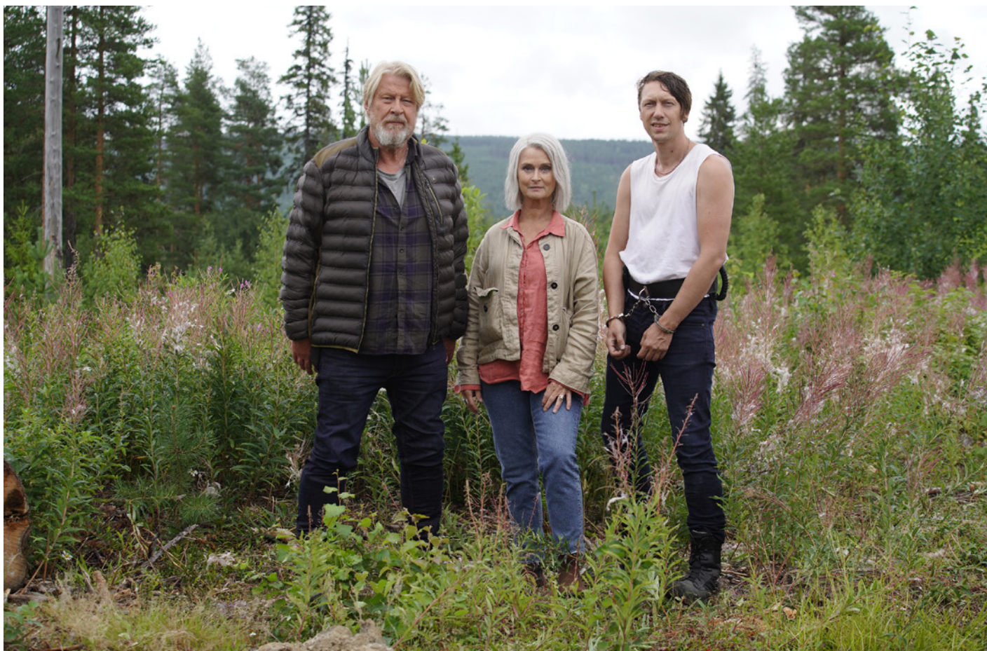
Rolf Lassgård, Lena Endre och Simon J Berger har huvudroller i den andra säsongen av TV-serien Jägarna.