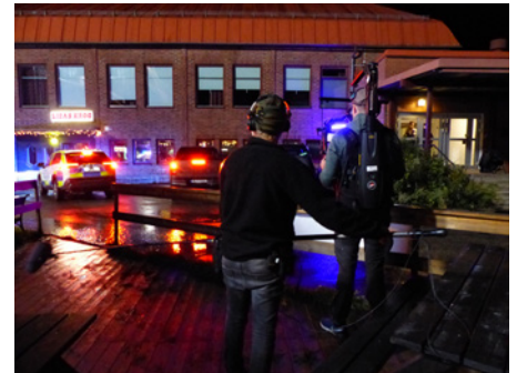
Kameraman och ljudtekniker spelar in scen utanför "Lizas krog".

Den första säsongen blev C Mores mest framgångsrika premiär någonsin.