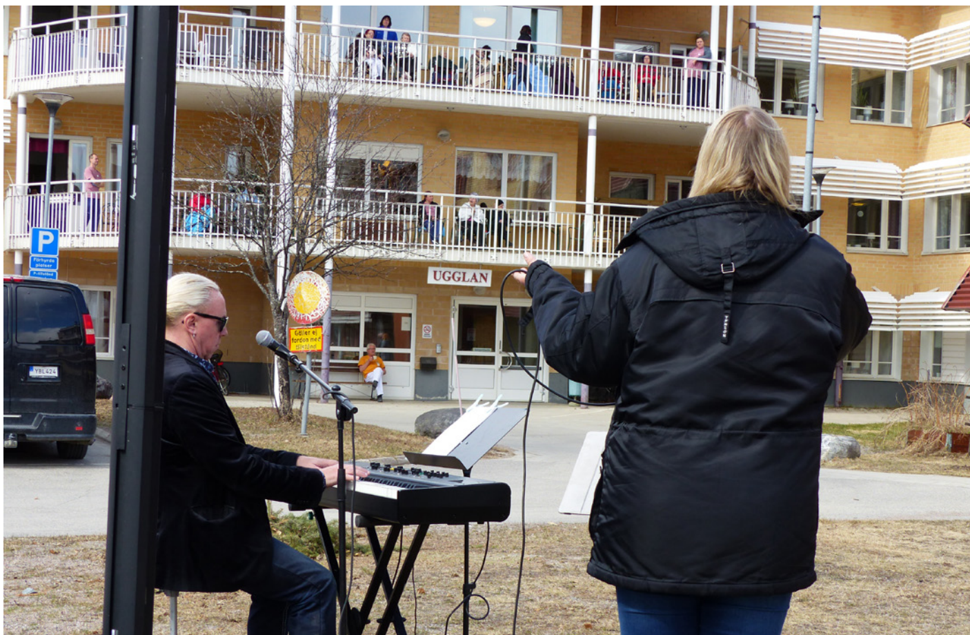
Boende och personal på Ugglan uppskattade konserten som de kunde se och höra från balkongen.