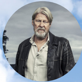
Jägarna säsong 2