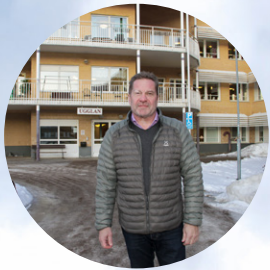
Coronaläget i socialtjänsten