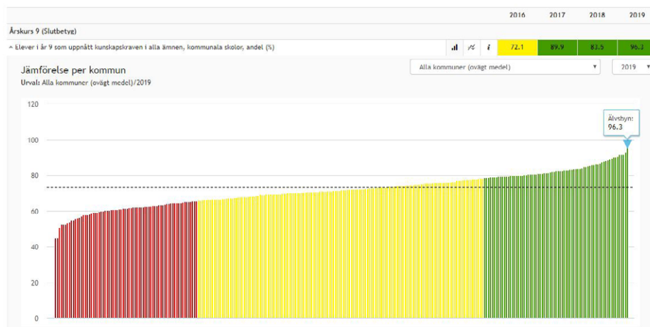
Varje stapel i bilden representerar en av landets 290 kommuner. Den gröna stapeln längst till höger med högst resultat är Älvsbyns kommun.

Det ser också ljus ut inför framtiden. Alla förskollärare i kommunen har genomgått läsluft och det är Älvsbyns kommun ensam om. Läsluft är också en byggsten inför framtiden.