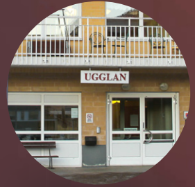
Friskast personal i Sverige