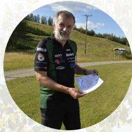
Tjurskallighet är en positiv egenskap