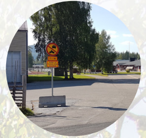
Förbud och polis- kontroller vid ishallen