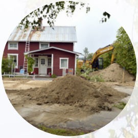
Sparat 210 miljoner liter vatten