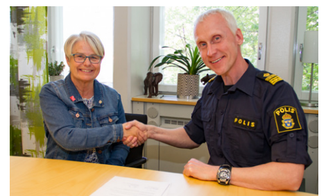
Undertecknande av gemensamt merborgarlöfte med Polisen.