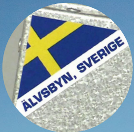
Acetec fortsätter växa