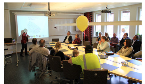
Välkommande av nyinflyttade.

– Jag ser en ljus framtid. Bolidens ansökan om gruvetablering fortsätter enligt plan. Arbetet med att etablera datacenter fortgår. Intressanta projekt tillsammans med LTU. Förskolan, skolan fortsätter sina utvecklingsarbeten. Äldreomsorgen har arbete på gång som innebär focus på uppdrag. Vi har ett samhälle där föreningar arbetar ideellt och bidrar med integration och mångfald. Det stundar ett skoter-VM i mars/april i Älvsbyn. Vi bygger hyreshus och säljer villatomter och industritomter. Det bästa av allt är att vi ökar i befolkning.