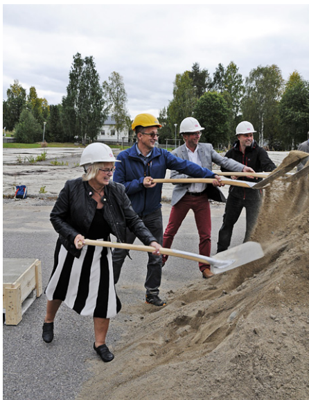
Första spadtaget ICA Supermarket Älvsbyn.

– Jag är stolt över förtroendet att förvalta kommunalrådsuppdraget i Älvsbyns kommun. Det är en perfekt kommun att leva och bo i. Den är lagom stor, har god potential och ett bra näringslivsklimat som bär kommunen framåt.