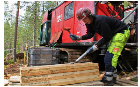
Provborrhning i Laver.

Bergsstaten och Boliden är överens om att det behövs ett Natura 2000-tillstånd (en miljöprövning). Bergsstaten säger att tillståndet behövs redan när man söker bearbetningstillstånd som i detta läge. Boliden säger att så har det inte gjorts förut och det behöver man inte ha förrän vid den stora miljöprövningen hos Mark- och miljödomstolen i nästa steg. Eftersom Boliden inte har lämnat in något Natura 2000-tillstånd till Bergsstaten har de avslagit ansökan om bear-