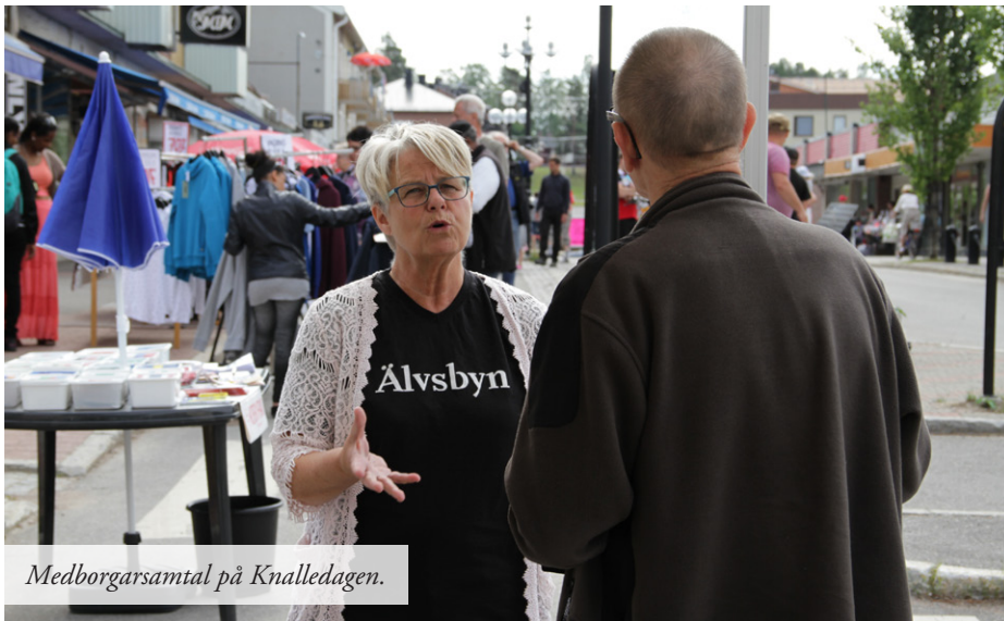
Medborgarsamtal på Knalledagen.