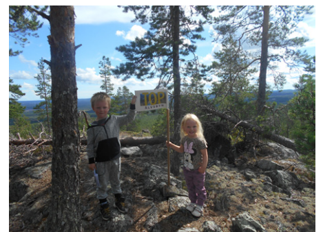
på Stor-Ålgberget.