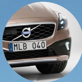
Från väveri till Volvo