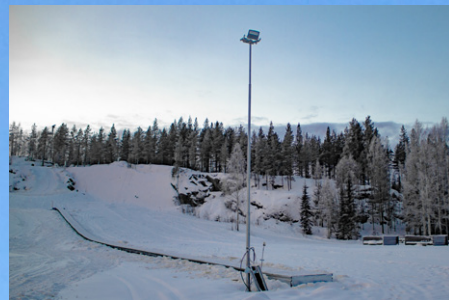
Den nya bandliften vid pulkbacken.