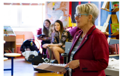
Utdelning av babypaket till nyfödda.