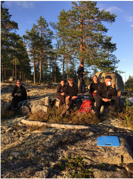
på Kälsberget.