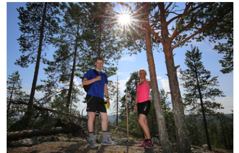
på Stor-Ålgberget.