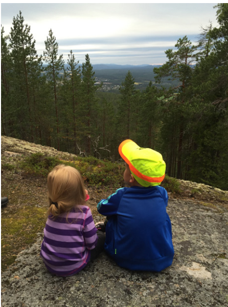
på Rackberget.