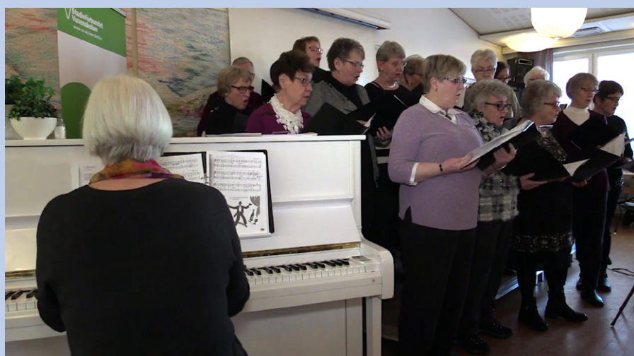
Från invigningen av äldre- och anhörigveckan.

Den 28 februari är sista dagen för inlämning av föreningsuppgifter. Föreningsmöte väntas äga rum i mars.