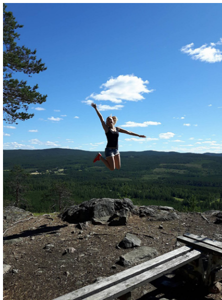
på Död-Lassberget.