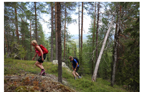
på Nattberget.