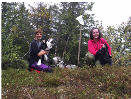
på Vitberget.