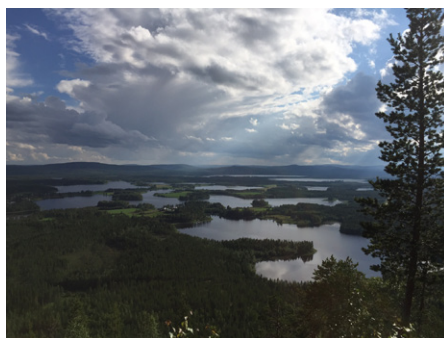
på Västra Falkberget.