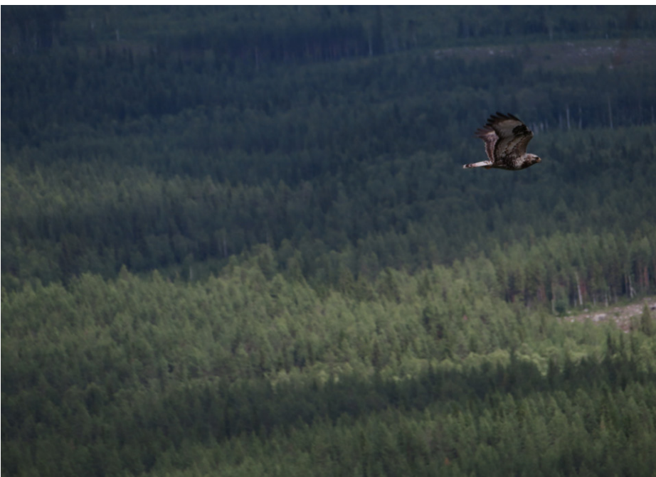
vy från Kvällsberget.