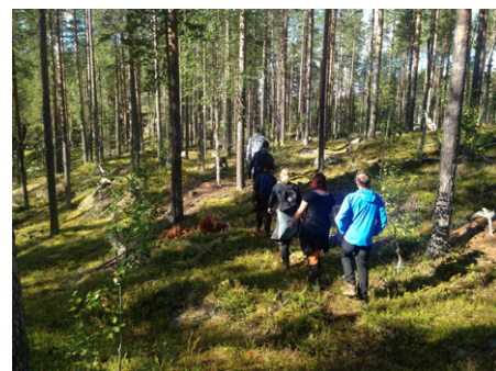
på Död-Lassberget.