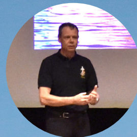
Astronaut besökte Älvsbyn