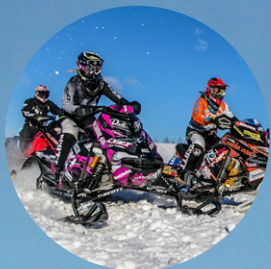
Skoter-VM till Älvsbyn