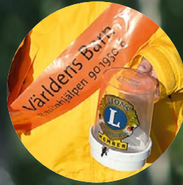
Glädje med hjärta