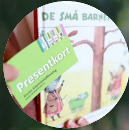
Välkomnar med babypaket