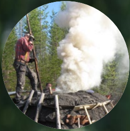
Kulturdag med kolmila