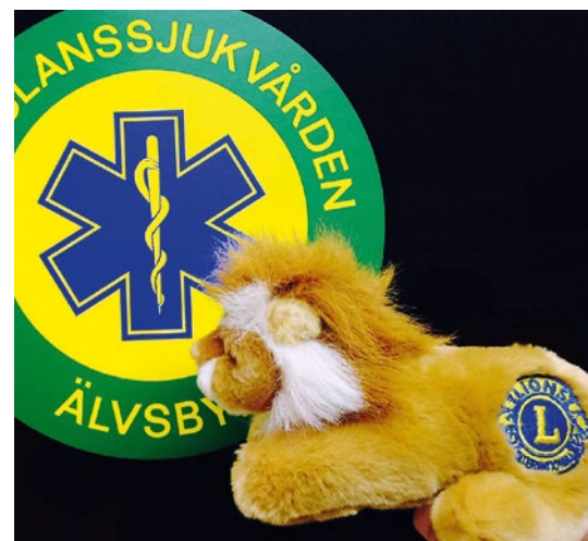
Älvsby Lions Club ger även Lions Lejon till Älvsby ambulansen.

Men också nationella och internationella insamlingar görs. Bland annat samlar de in glasögon åt fattiga runt om i världen som Optiker utan gränser sedan delar ut i sitt biståndsarbete. De hjälper också