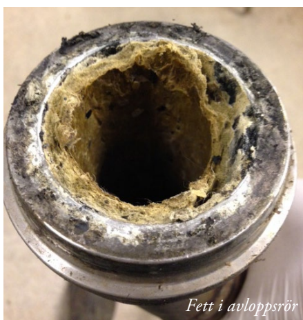
Fett i avloppsrör

Hushållens spillvatten tas om hand av vårt avloppsledningsnät. Ett växande problem är att fett hamnar i avloppet (se bild). När avloppsvattnet kyls ner i ledningsnätet, stelnar fett och fastnar vilket leder till att ledningarna sätts igen och det blir avloppsstopp. Har man otur kan det orsaka översvämning i källarutrymmen.