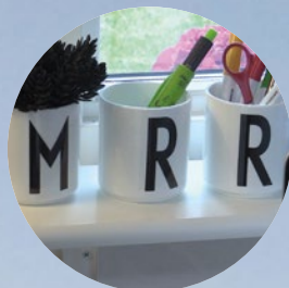
MRR, Min resa räknas