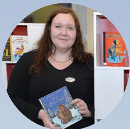
Läslyftet för alla