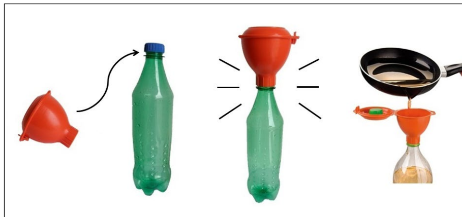
Hämta ut en Miljötratt på återvinningscentralen gratis

Flaskan lämnar du helst på på ÅVCn, alternativt släng i brännbara hushållssopor. På ÅVCn tömmer vi flaskorna och skickar för biogasframställning.