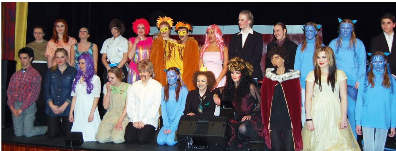
Elever från Älvåkraskolans teaterprojekt 2011