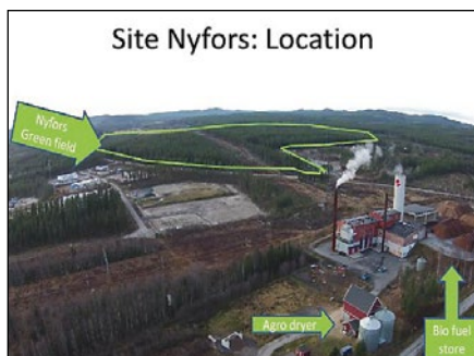
Område för etablering av datacenter

Sommaren 2014 startade vi en översyn om förutsättningarna för etableringar inom datacenter. Vi granskade åtta olika platser för etableringar, där endast en plats var intressant, det var i vårt framtida industriområde Nyfors. Vi gick sedan vidare med en djupare utredning av området i Nyfors som var mycket intressant.