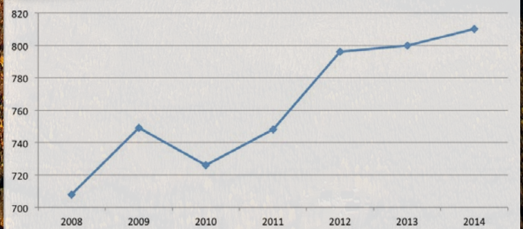
Antal aktiva företag i Älvsbyn