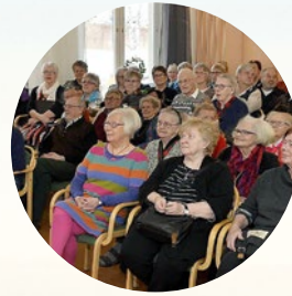
Välbesökt äldre- och anhörigvecka