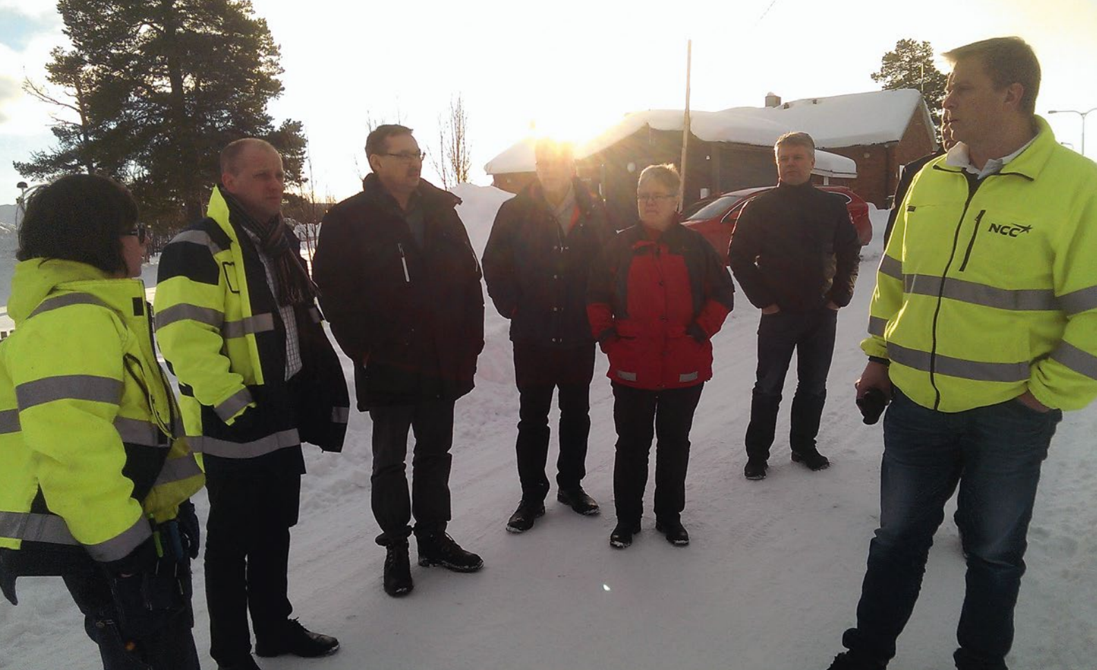
Representanter från kommunen på studiebesök om byggande i Kiruna.