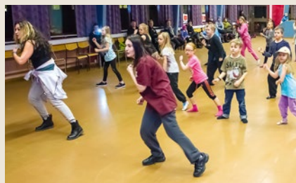
Kurs i breaking på Forum

Under våren hålls kurser i breaking (breakdance) med Exiled Dance Crew och Mutcho/NBV anordnar kurs i afrikansk dans.