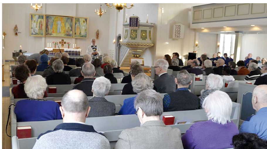
Pensionärernas dag i kyrkan