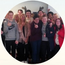
Ung företagsamhet (UF)