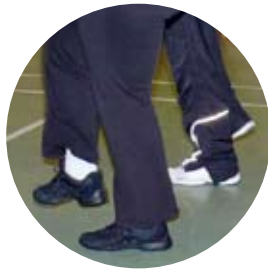
Dansgång det svänger om