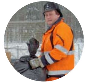
De hjälper oss sortera rätt