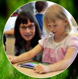
Barnen ger glädje och energi