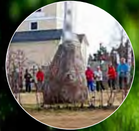
Rymdpromenad till monumentet