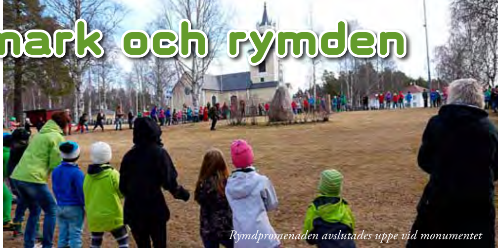
Rymdpromenaden avslutades uppe vid monumentet