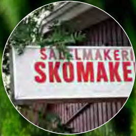
Forsmarks Skomakeri - ett ovanligt företag