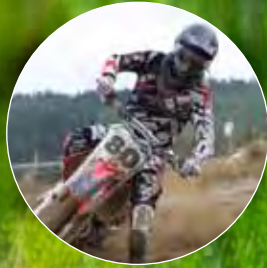
Älvsbyns Motorsällskap satsar på säkerheten