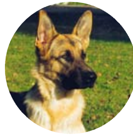
Människans bästa vän!