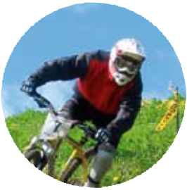
Storsatsning i Kanis har gett resultat