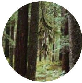
Carina tipsar om grön friskvård