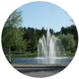
Många besöksmål i kommunen