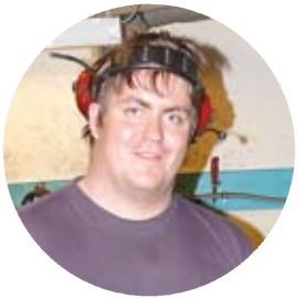
Ung företagare som vågar satsa