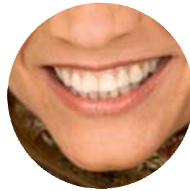
Allt friskare tänder i kommunen