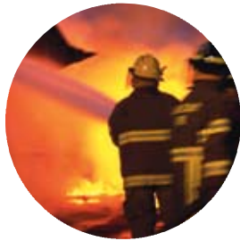
Spännande yrke med höga krav