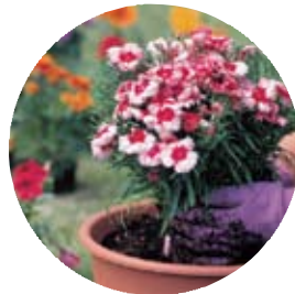
Yrke med känsla för grönt