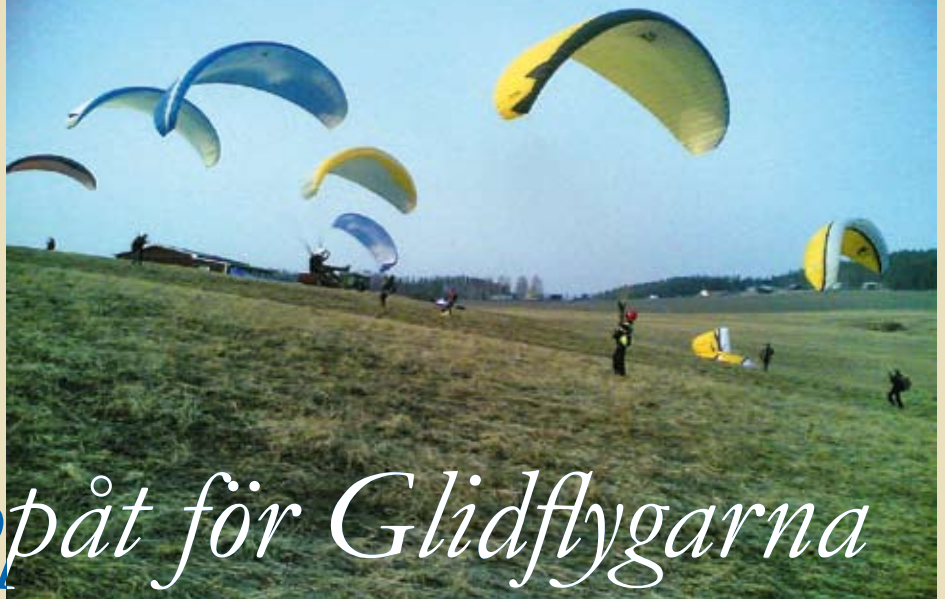
Markträning på de öppna fälten i Lillkorsträsk.

med en licensierad instruktör, innan man är redo att flyga själv för första gången.