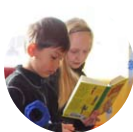
Barn och ungdomar i Älvsbyn läser mycket