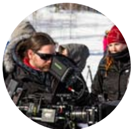
Satsning på film bra för kommunen