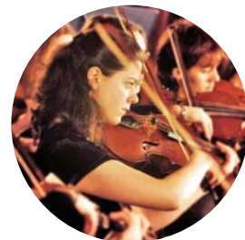
Kulturutbud och evenemang