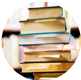
Varierande arbete på "Bibblan"