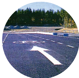
Miljösatsning med ny återvinningscentral