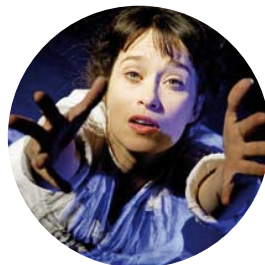
Förening som brinner för teater