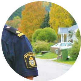
Områdespoliser förebygger brott