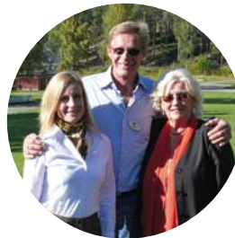
Behandlingshem som bidrar till bygden