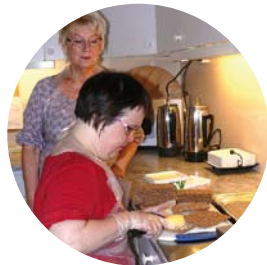
De jobbar med att ge människor stöd