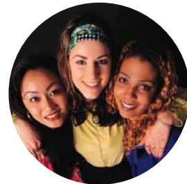
Vänskapsföreningen skapar kontakter