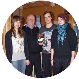
Älvsbyn bäst på Ung Företagsamhet