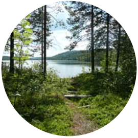
Näringslivskontoret skapar förutsättningar