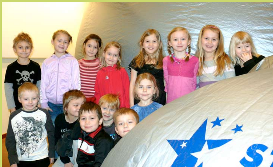
Elever från Bäckskolans förskoleklass besökte det mobila planetariet när det var i Älvsbyn.