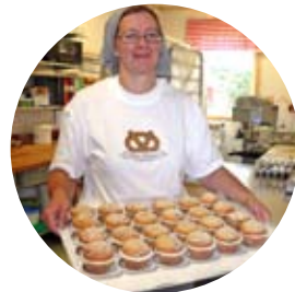
Närproducerat hos Uddens Hembageri