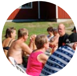
Populär byaförening i Bredsel