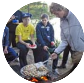
Med äventyr på skolschemat