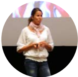
Världsmästarinna ger tips för att lyckas