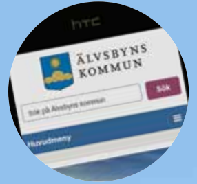
Kommunens webbplats byggs om