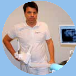
Målare startade tandklinik i kyrka