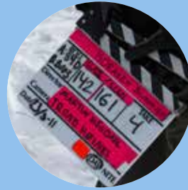
Långfilmsinspelning i Paris, Teuger och Pålsträsk!