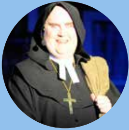
Ett svammel i tre rätter