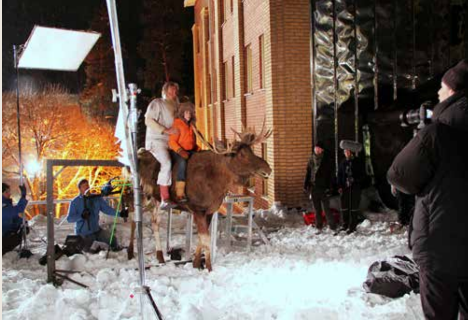
Från filminspelningen "A Christmoose Story" på taket till Polar hotell. Filmen har haft premiär i Holland och sverigepremiären är i januari.

Lägenheterna används som boende för flyktingbarn och ungdomar i åldrarna 13 - 18 år som har ensam kommit till Älvsbyn och väntar på besked om uppehållstillstånd. På plats finns även personal dygnet runt som finns där för ungdomarna och som handleder dom inför eventuell integration med samhället.