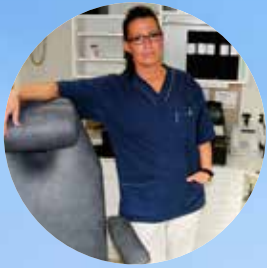
Det är viktigt att se om sina fötter