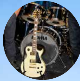
Ett bättre musikliv i Älvsbyn