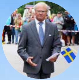
Älvsbyn lämnade avtryck hos kungaparet