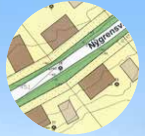
Nya tomter till salu på Prästgården