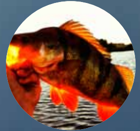
Dolda skatter i Älvsbyns vatten