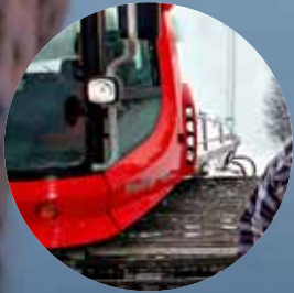
Ett kontrastrikt jobb