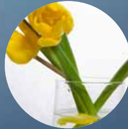
Meningsfull vardag i social samvaro