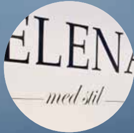
Helenas med stil - en succé