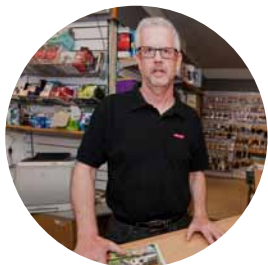
Ola utökar sin verksamhet i Älvsbyn