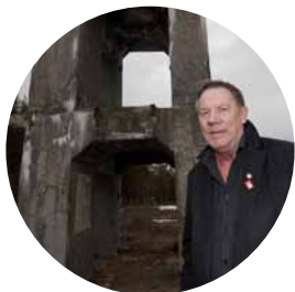
Kommunrådet ser en ljusnande framtid